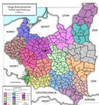
po I Wojnie Światowej

Po II Wojnie Światowej granice Polski w sposób poza-traktatowy zostały ustalone, z odebraniem Polsce Kresów Wschodnich, a dołożeniem Ziemi Odzyskanych tzn. będących składową Królestwa Polskiego już za czasów Króla Bolesława Chrobrego. Per saldo, obszar Polski znacznie zmniejszył się.