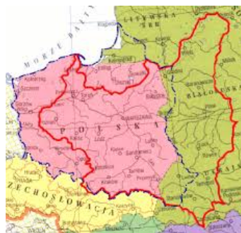
po II Wojnie Światowej