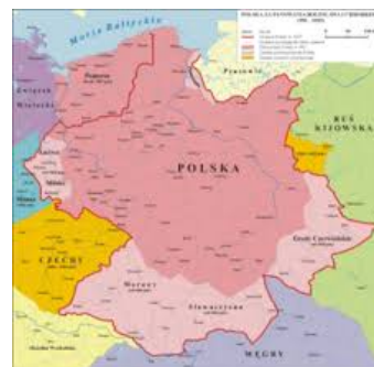
za Króla Bolesława Chrobrego

Przypomnijmy mapę Królestwa Polskiego przed zaborami w XVIII wieku (poniżej), gdy Polska była około trzy razy większa niż obecnie.